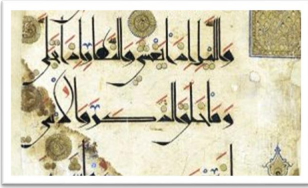
Esempio di cufico

L'insieme degli stili calligrafici si può dividere generalmente in due gruppi: le scritture di carattere solenne, riservate ai testi sacri, e quelle corsive, utilizzate per uso corrente. Le prime sono più spigolose, lineari e allungate, mentre le seconde hanno caratteri maggiormente arrotondati. Lo stile calligrafico di lingua araba più antico che raggiunse una certa diffusione intorno al IX secolo è il cufico (dalla città di Kufa in Iraq).